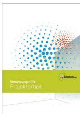
Handreichung Abschlusszertifikat und Umsetzungshilfe Projektarbeit