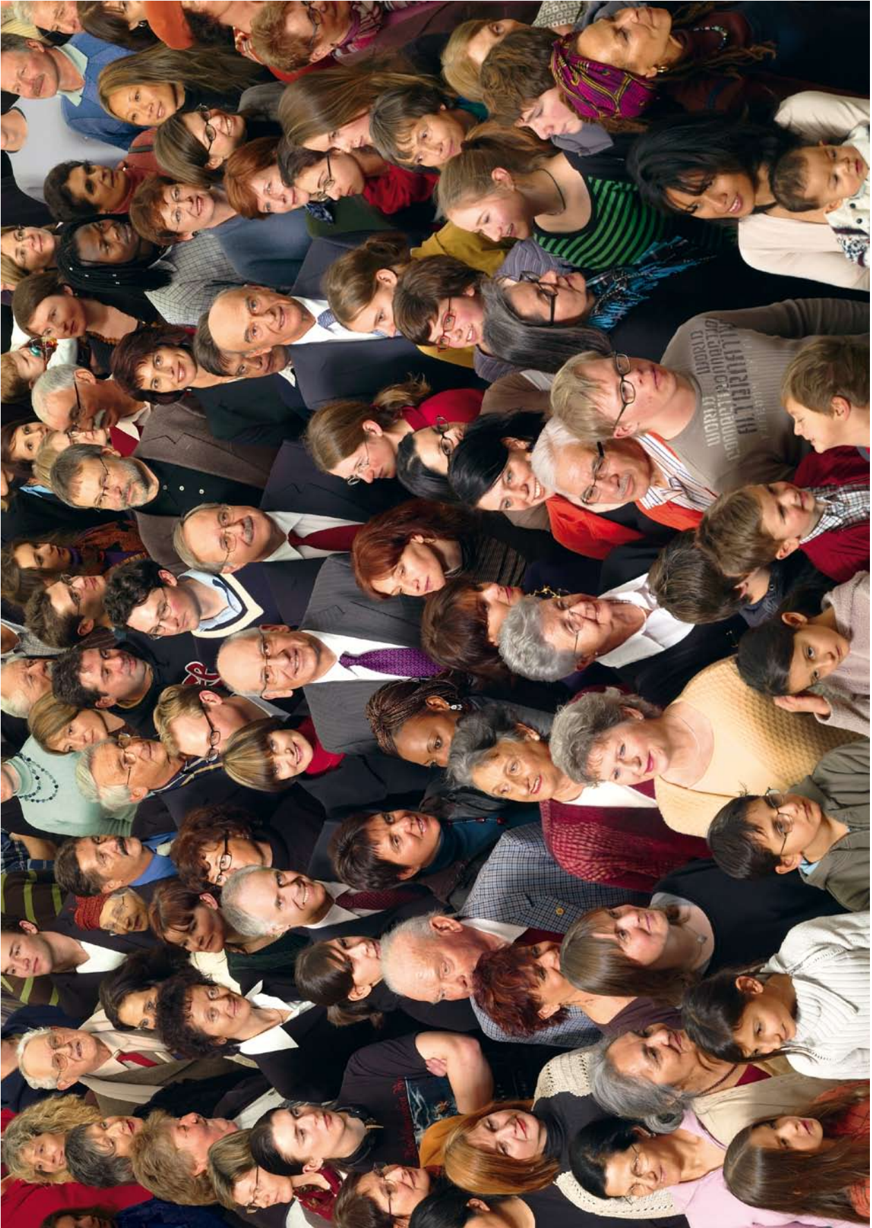
Bundesratsfoto von 2008.