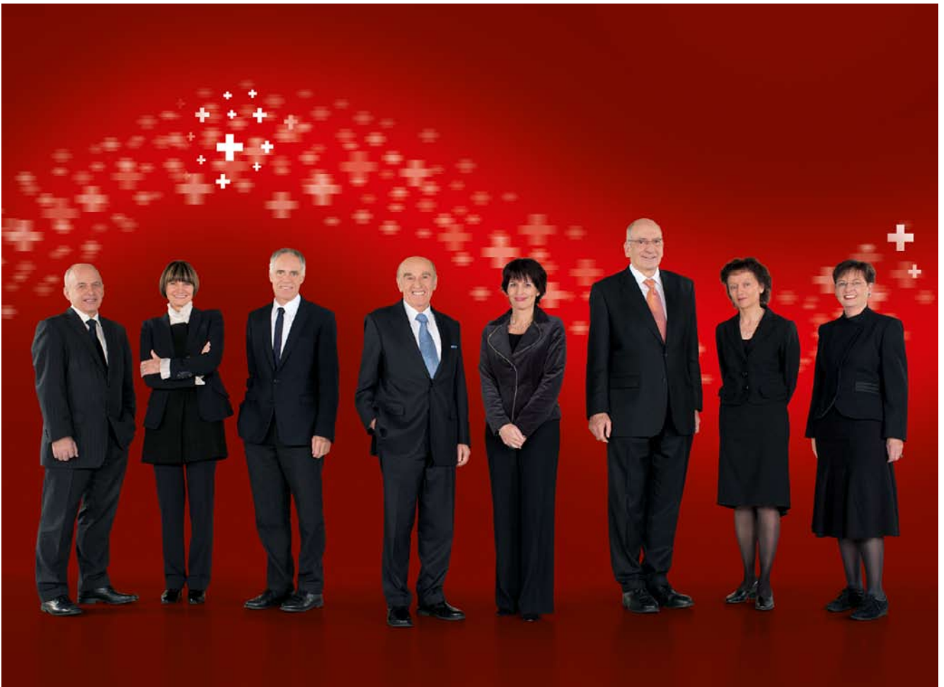
Offizielles Bundesratsfoto 2009 (Stand: Oktober 2009)

www.de.wikipedia.org/wiki/Bundesrat_(Schweiz)