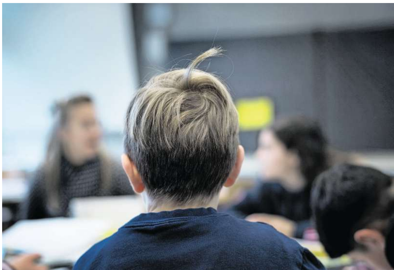
Heute besuchen fast alle Kinder den Regelunterricht. Der Bevölkerung passt das nicht.

Die Parteizugehörigkeit der Befragten spielt bei der Beantwortung der Frage eine entscheidende Rolle. Ledig-